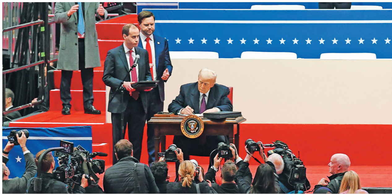
美国总统特朗普近日签署一系列行政令。

路透社报道，拜登政府对俄罗斯施加全方位严厉制裁，包括俄金融、国防、制造、能源、技术等领域数以千计实体和个人。拜登卸任前，美国财政部对俄罗斯能源领域再次追加制裁。但一些分析师指出，美欧国家可以用于对俄制裁的选项越来越少，手中的牌越来越有限。